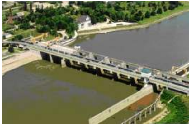
4. ábra. Kiskörei vízlépcső, a Tisza-tó „lelke”

A Kiskörei Vízlépcső (4. ábra), Kisköre község határában, a Tisza torkolatától 403,2 km-re, a jobb parton létesített 1,8 km hosszú átvágásban épült, 1967 és 1973 között. A létesítményt 1973. május 16-án helyezték üzembe (Vízügyi Közlemények, 1973).