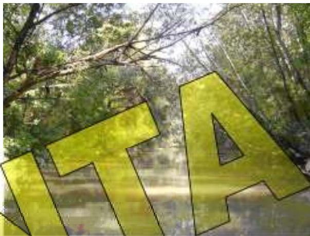
3. ábra. Kis-Tisza természetes vízfolyás

A Tisza felőli kitorkolásnál szabályozó műtárgyak (9 db) épültek az 1980-as évek elejétől kezdődően, melyek nyitott, vagy zárt üzemmódban lehetnek. Feladatuk, az öblítő csatornák által szállított víz áramlási viszonyainak szabályozásával biztosítani a megfelelő vízcserét, ugyanakkor az árhullámokkal érkező nagy mennyiségű hordalék, uszadék bejutási lehetőségét csökkenteni, mérsékelni ezáltal a medencék feliszapolódását, valamint a főmederben levonuló esetleges szennyeződések kirekesztését a tározó belső vizeitől.