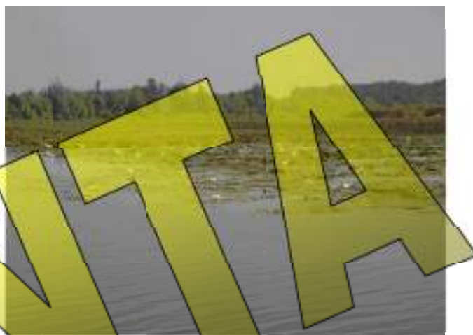
1. ábra. A tündérrózsás Óhalászi Holt-Tisza

A Kiskörei-vízlépcső feletti hullámtéren helyezkedik el a Tisza-tó, a Tisza folyó 404-440 folyamkilométer közötti szakaszán, Kisköre és Tiszabábolna között (2. ábra). A tó középvonal menti hossza 33 km, legnagyobb szélessége 6,6 km - Poroszló és Tiszafüred között -, míg a legkeskenyebb Tiszacseres térségében, ahol 0,6 km. A két oldali tározó (árvízvédelmi) töltés