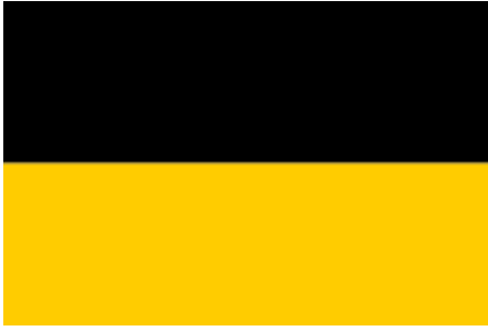
A Habsburgok zászlaja, mely a kiegyezésig az Osztrák Császárság zászlajaként is szolgált, azután pedig az Osztrák–Magyar Monarchia osztrák felének zászlajaként