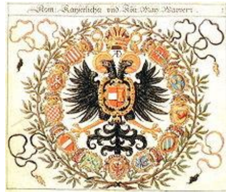
A Habsburg császár címere, számos területével.

A Habsburg-család (1740-ig, illetve a magyar trónon 1780-ig Habsburg-ház; 1745-től, illetve 1780-tól Habsburg–Lotaringiai-ház) Európa egyik legjelentősebb uralkodói családja volt, amely német királyok, német-római császárok, cseh, magyar, spanyol és portugál királyok sorát adta. A család tagjai emellett különböző időszakokban számtalan itáliai és németországi hercegség, választófejedelemség stb. urai voltak.