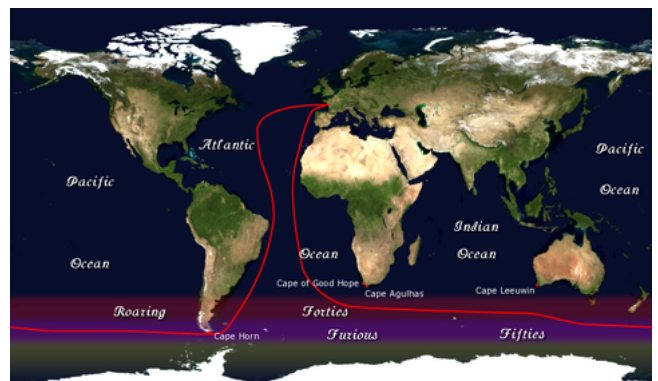
Vendée Globe 92-93 útvonala az „üvöltő negyveneseket” ( roaring forties ) és a még délebbre fekvő „dühöngő ötveneseket” ( furious Fifties ) [5] érintve a Déli-óceánon keresztül

A verseny kiinduló és végpontja Les Sables-d'Olonne , amely Franciaország Vendée megyéjében található. Maga Les Sables-d'Olonne város és Vendée megye is hivatalos versenyszponzor. Az útvonal az úgynevezett klipper-útvonalat követi: Les Sables-d'Olonne-ból az Atlanti-óceánon le, délre, a Jóreménység fokáig; majd az óramutató járásával megegyező irányában haladás a déli tengereken az Antarktisz körül, megkerülve Cape Leeuwint és a Horn-fokot , majd vissza a Les Sables-d'Olonne-ba. A verseny általában novembertől februárig tart, és úgy időzítették, hogy a versenyzők a Déli-óceánt az ausztrál nyár alatt szeljék át. További fordulópontok iktathatóak a versenybe a biztonság érdekében (tekintettel a jéghegyekre, szélsőséges időjárási viszonyokra).