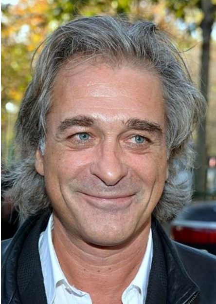
Titouan Lamazou az 1989-1990-es Vendée Globe győztese