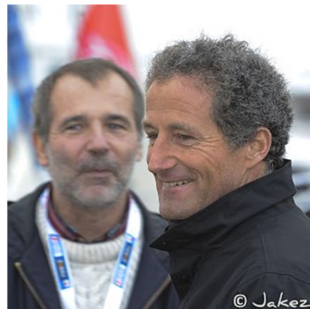
Michel Desjoyeaux 2012-ben a Vendée Globeon