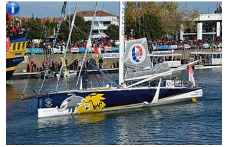
Egyike az új "bajszos" hajóknak, amely részt vett a versenyen

Végül az első négy helyezett mind ezt a technikai újítást használta, ezáltal is nyilvánvalóvá téve, hogy megkerülhetetlen a használata a többiek részére is. A futam győztese Armel Le Cléac'h lett, 2017. január 19-én befejezve a versenyt. Új csúcs született: 74 nap, három óra és 35 perc kellett a leggyorsabb Földkerüléshez. Más csúcsok is megdőltek a verseny folyamán: így az egytestű vitorlás hajó által 24 óra alatt megtett legnagyobb távolság, a leggyorsabb dél felé tartó átkelés az Egyenlítőn és a Jóreménység Fokán Alex Thomson által. A győztes Armel le Cleac'h pedig megdöntötte a Cape Leeuwin-fok, a Horn-fok és az Egyenlítő (észak felé) való elérésében.