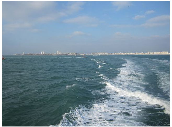
Les Sables-d'Olonne a Vendée Globe verseny start-cél kikötője a tenger felől

A versenyt 1989-ben alapította a francia vitorlázó Philippe Jeantot "Vendée Globe Challenge" név alatt. Jeantot két alkalommal (1982-1983 és 1986-1987-ben) megnyerte a BOC Challenge (jelenleg Velux 5 Oceans Race) nevű versenyt. Elégedetlen volt a verseny kereteivel, és úgy döntött, hogy létrehoz egy új, egyszemélyes, kikötési lehetőség nélküli földkerülő versenyt, amely a hajósok végső, legszélsőségebb erőpróbája lesz. Az első versenyt 1989-1990-ben tartották meg, és Titouan Lamazou nyerte meg. Jeantot is részt vett a versenyen, negyedik helyezést elérve. A következő futam 1992-1993-ben volt, azóta pedig négyévente tartják meg.