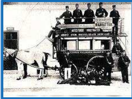
A Székesfővárosi Közlekedési Vállalat omnibusza 1896-ban