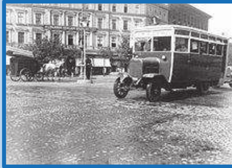
1-es jelzésű, egyszintesre átépített MARTA busz az Oktogonnál 1927-be