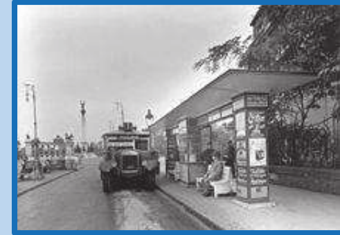
1-es busz a Hősök terénél 1938-ban

Néhány jármű még közforgalomban is részt vesz. A budapesti buszközlekedés 100. évfordulójának emlékére a BPO-100 rendszámú Ikarus 260.46-os járművet megőrzendőnek jelölték ki.