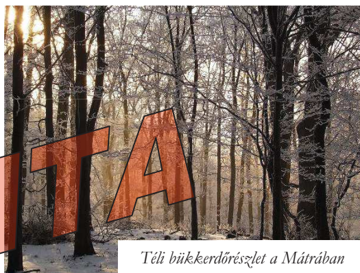
Téli bükkerdőrészlet a Mátrában

A nógrádi táj igazi jellegét a Cserhát adja meg, ami az Északi-középhegység legváltozatosabb része. Nagy kiterjedésű részletei még a 300m-es magasságot sem érik el, ennek köszönhetően szinte átmenet nélkül illeszkedik a szomszédos Nógrádi-medencéhez és a Zagyva-völgyhöz. A Cserhát völgyekben és forrásokban gazdag. A Zagyva és a Tarna között emelkedő Mátrának csupán az északnyugati területe tartozik Nógrád megyéhez, amit Nyugati- vagy Pásztói-Mátra néven is ismerünk. A Nyugati-Mátra legnagyobb magasságát a 805 méteres Muzsla