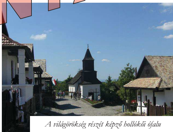
A világörökség részét képező hollókői ófalva