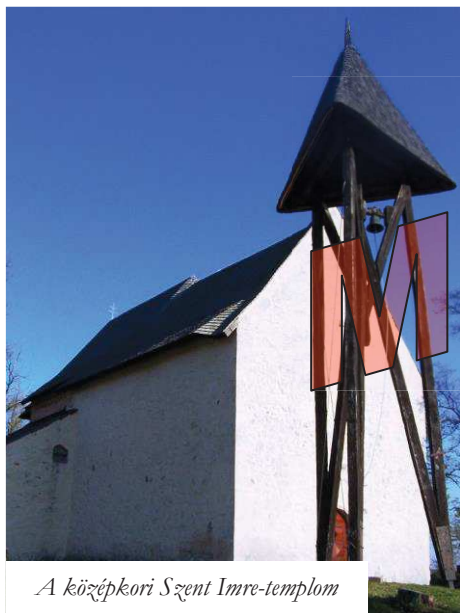
A középkori Szent Imre-templom

Az időszámítások kezdetén a nomád, állattenyésztő jazigok és quadok lakták a területet. Az észak felé irányuló kereskedelmi útvonal mentén alakult ki a terület első települése, Philecia (Fülek). A két nép 173-ban ütközött meg Marcus Aurelius csapataival a Diósjenő melletti területekért. Később gall, bolgár – török – szláv törzsek birtokolták a területet, majd a különböző népcsoportok összeolvadtak, végül a palócok lettek a megye végső lakosai, akiknek eredetére vonatkozóan a mai napig többféle elmélet áll fenn. Nógrádot Árpád vezér a Gyarmat, Jenő, Keszi és Tarján nemzetség törzsfői között osztotta fel. Nógrád politikai, gazdasági és katonai-biztonsági jelentőségét bizonyítja az is, hogy a XIV-XV. században már 42 vár állt a területén. A török hódoltság és a Rákóczi szabadságharc utáni időszakok feldúlták a vidéket és lakosságát. A század legnagyobb felfedezése az 1768-ban, Tarján határában talált