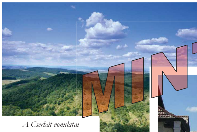
A Cserhát vonulatai

Épített környezetében a megye kiemelkedő fontos műemléki értékeit képviselik a kastélyok és kúriák. 24 műemlék kastély és 33 műemlék kúriájának legtöbbje barokk és klasszicista épület. A többi 13 kastély és 60 nemesi kúria helyi védelem alatt áll. A megye területe földrajzi-geomorfológiai adottságainál fogva rendkívül alkalmas volt várépítésre: 10 vár, ill. várrom van műemléki védeltség alatt: a bujáki, drégelypalánki, nógrádi, hasznosi, sámsonházai és szandai várrom, a Salgó- és Hollókői vár, továbbá a tari várkastély romja, valamint a szécsényi várbástyák és várfalak. A mai megyeterületen lévő várak közül Hollókő és Salgó vára maradt meg a legépebben.